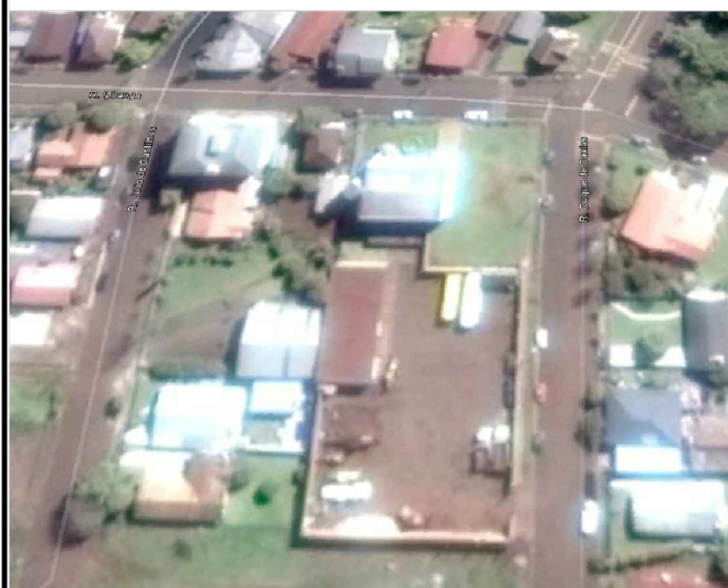
SITUAÇÃO E LOCALIZAÇÃO ESCALA 1:250