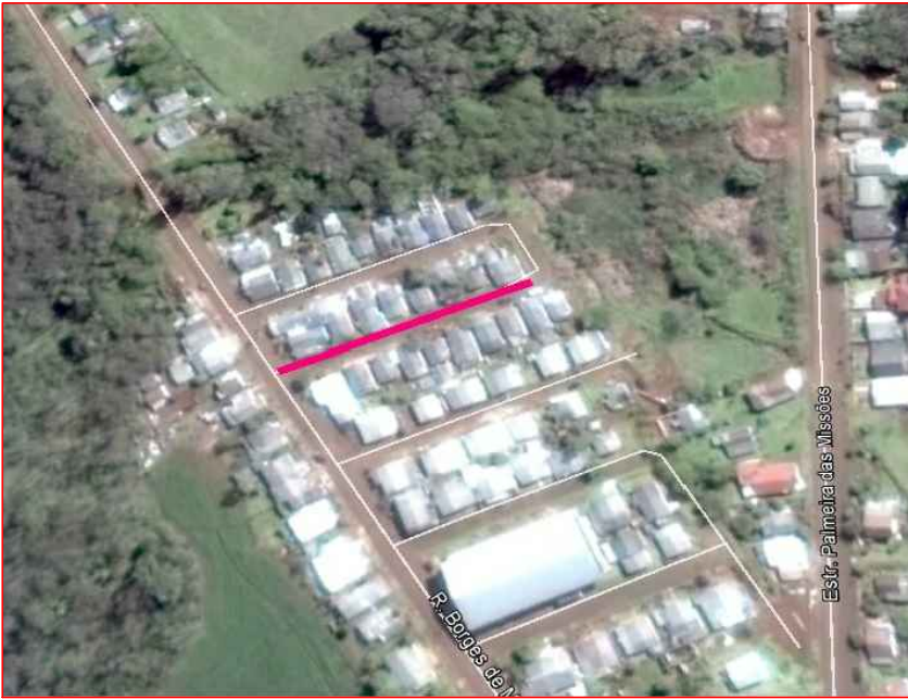
SITUAÇÃO E LOCALIZAÇÃO S.E.