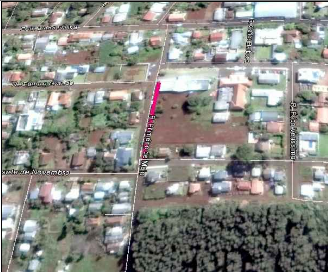
SITUAÇÃO E LOCALIZAÇÃO S.E.

PERFIL TRANSVERSAL RUA 1º DE MAIO PAVIMENTAÇÃO C.B.U.Q - SOBRE CALÇAMENTO EXISTENTE