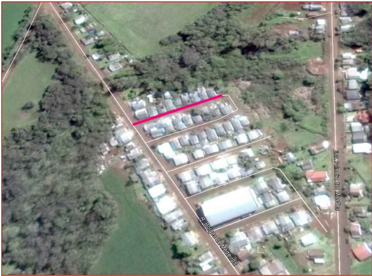
SITUAÇÃO E LOCALIZAÇÃO S.E.