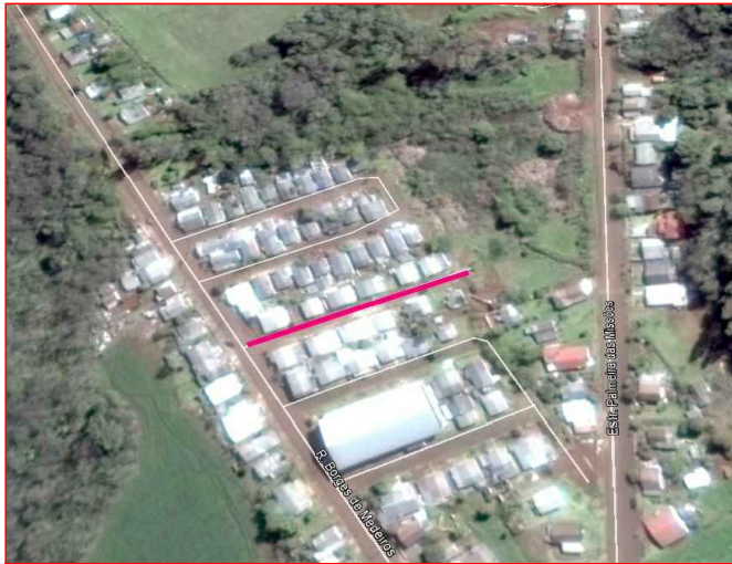
SITUAÇÃO E LOCALIZAÇÃO S.E.