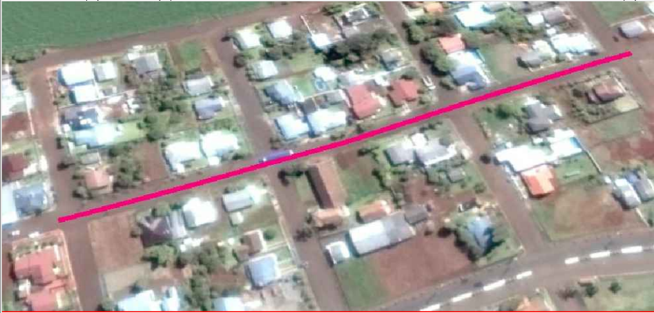
SITUAÇÃO E LOCALIZAÇÃO S.E.