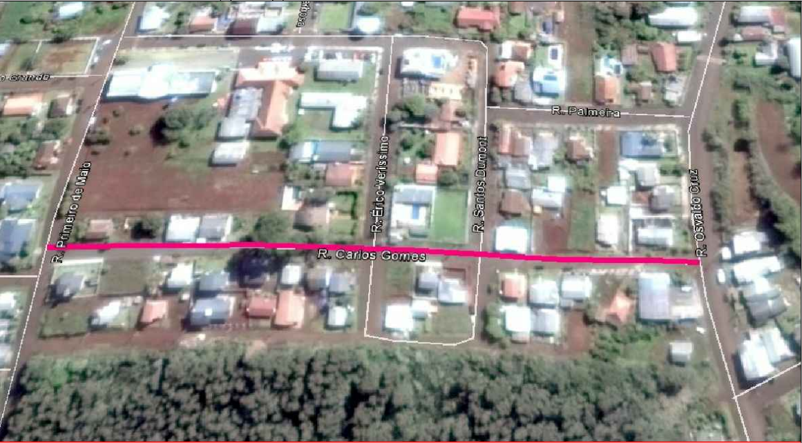
SITUAÇÃO E LOCALIZAÇÃO S.E.

PERFIL TRANSVERSAL RUA CARLOS GOMES PAVIMENTAÇÃO C.B.U.Q - SOBRE CALÇAMENTO EXISTENTE