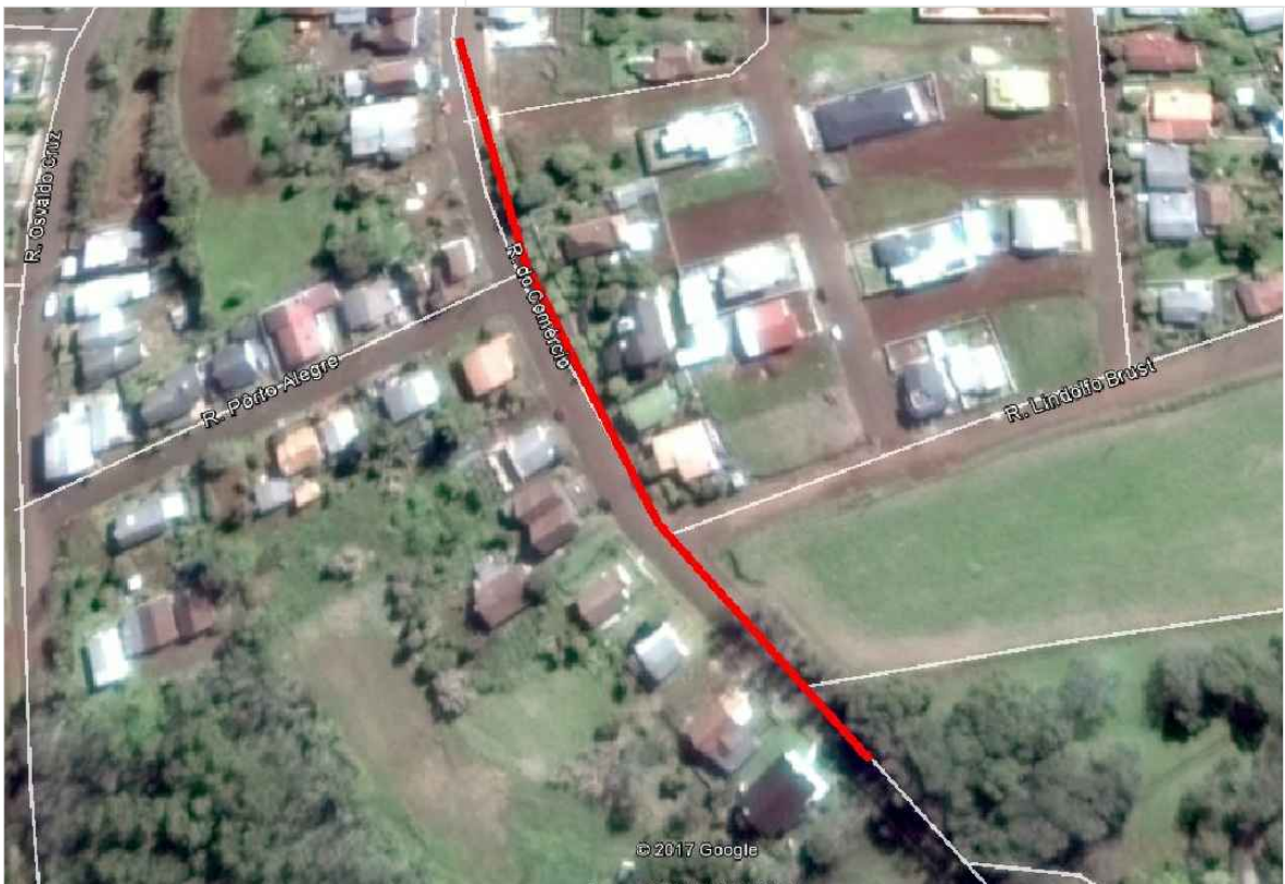
SITUAÇÃO E LOCALIZAÇÃO S.E.